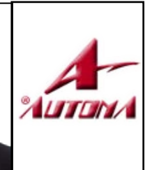
Automa SRL Consigliere