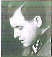
MENGELE Il «dottor morte», noto per i suoi esperimenti, fuggì in Sudamerica