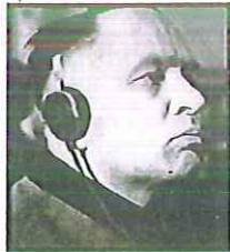
HÖSS Il comandante del campo. Dove, dopo Norimberga, venne impiccato